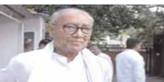
लाखों बेरोजगार युवाओं के भविष्य के साथ खिलवाड़ का लगाया आरोप

भोपाल, देशबन्धु। मध्य प्रदेश के पूर्व मुख्यमंत्री दिग्विजय सिंह ने कर्मचारी चयन मंडल (ईएसबी) द्वारा आयोजित भर्ती परीक्षाओं में सामने आई गड़बड़ियों की सीबीआई या एसआईटी से जांच करने की मांग की है।