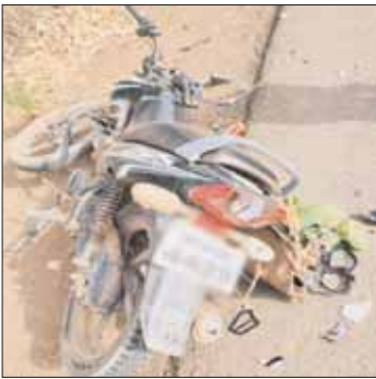
कंट्रोल रूम डायल-112 भोपाल को

सिरोंज, देशबन्धु। थाना सिरोंज क्षेत्र के भोपाल रोड पर दो मोटरसाइकिलों की आमने-सामने हुई टक्कर में घायल चार लोगों को डायल-112 की तत्परता से समय पर उपचार मिल सका। पुलिस जवानों ने मौके पर पहुंचकर घायलों को अस्पताल पहुंचाया, जिससे उन्हें तत्काल चिकित्सकीय सहायता उपलब्ध हो सकी।