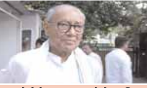
लाखों बेरोजगार युवाओं के भविष्य के साथ खिलवाड़ का लगाया आरोप

भोपाल, देशबन्धु। मध्य प्रदेश के पूर्व मुख्यमंत्री दिग्विजय सिंह ने कर्मचारी चयन मंडल (ईएसबी) द्वारा आयोजित भर्ती परीक्षाओं में सामने आई गड़बड़ियों की सीबीआई या एसआईटी से जांच करने की मांग की है। दिग्विजय सिंह ने मध्य प्रदेश के मुख्यमंत्री मोहन यादव को पत्र लिखकर मध्य प्रदेश कर्मचारी चयन मंडल (ईएसबी) द्वारा आयोजित भर्ती परीक्षाओं में सामने आई तकनीकी विफलताओं, टेंडर प्रक्रिया में संभावित अनियमितताओं तथा लाखों बेरोजगार युवाओं के भविष्य के साथ हो रहे