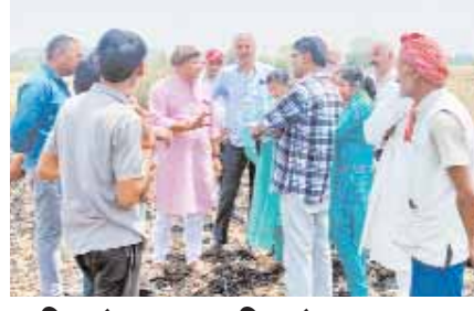
7 दिन में मुआवजा दिलाने का आश्वासन

जमी रहती है। पता नहीं कौन जिम्मेदार लोग नागौद की इस अति खराब ट्रैफिक व्यवस्था को सुधारने का श्रेय हासिल कर पाएगा।