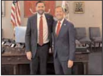
ध्यान केंद्रित किया गया। उन्होंने कहा, 'सुरक्षा प्राथमिकताओं पर मजबूत तालमेल है,' और जोड़ा कि पटेल 'एफबीआई में शानदार काम कर रहे हैं।'

वाशिंगटन, (एजेंसियां)। संयुक्त राज्य अमेरिका और भारत ने अपनी रणनीतिक साझेदारी में नई गति का संकेत दिया है। यह संकेत राष्ट्रपति डोनाल्ड ट्रंप द्वारा भारत में अमेरिकी राजदूत सर्जियो गोर के लिए आयोजित व्हाइट हाउस रात्रिभोज से पहले मिला। वहीं वाशिंगटन में हुई उच्चस्तरीय बैठकों की श्रृंखला ने सुरक्षा और राजनीतिक प्राथमिकताओं पर बढ़ती समानता को भी रेखांकित किया।