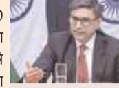
द्विपक्षीय सहयोग पर होगी चर्चा