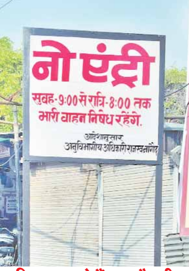
दिनभर मचाते हैं धमाकौकड़ी

अनुविभागीय दंडाधिकारी नागौद के आदेश एवं नगर परिषद के नो एंट्री बोर्ड के दम पर नगर में भारी वाहनों के प्रवेश पर रोक नहीं लग पा रही है। जिसके चलते कस्बे की यातायात व्यवस्था तो पटरी से उतरी हुई है जिसके चलते छोटे वाहन चालकों को महज परेशानी का सामना करना पड़ता है।